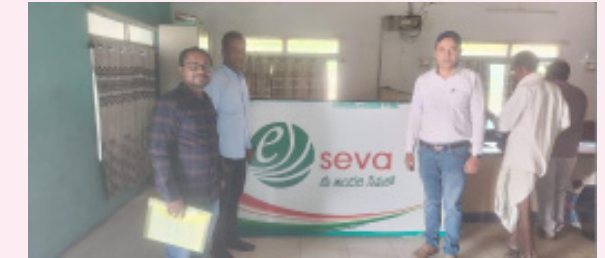
ఖచ్చితంగా పాలిస్తూ ప్రజలకు నాణ్యమైన సేవలు అందించాలని అధికారులకు తెలిపారు. కేంద్రాలలో పారదర్శకత ఉండేలా అవసరమైన సూచనలు ఇచ్చారు.