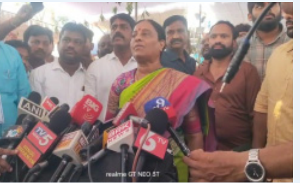
నేడు కళ్యాణ మహోత్సవాన్ని తిలకించిన భక్తులందరికీ శ్రీ రామచంద్ర స్వామి ఆశీస్సులు ఉండాలని, ప్రజా ప్రభుత్వానికి శ్రీరామచంద్రమూర్తి శక్తిని కల్పించి ప్రజలకు మెరుగైన సేవలు అందించేందుకు ఆశీర్వాదించాలని మంత్రి కోరారు.

భద్రాచలం, మార్చి 27 (భారతశక్తి): గోదావరి పుష్కరాల నాటికి తొలి దశ ఆలయ అభివృద్ధి పనులు పూర్తి చేస్తామని రాష్ట్ర దేవదాయ, ధర్మాదాయ శాఖ మంత్రి కొండా సురేఖ పేర్కొన్నారు. శుక్రవారం భద్రాచలంలోని శ్రీ సీతారామ చంద్ర స్వామి కళ్యాణ మహోత్సవ కార్యక్రమం అనంతరం మంత్రి కొండా సురేఖ మీడియాతో మాట్లాడుతూ భద్రాచలంలోని శ్రీ సీతారాముల వారి కళ్యాణానికి ప్రాముఖ్యత ఉందని, దేశ వ్యాప్తంగా కోట్లాది మంది ప్రజలు శ్రీ సీతారామచంద్ర స్వామి కళ్యాణాన్ని వీక్షిస్తారని, ప్రజా ప్రభుత్వం ఏర్పడిన తర్వాత మూడవ సంవత్సరం మంత్రిగా తాను ఈ కళ్యాణ మహోత్సవ వేడుకల్లో పాల్గొనడం సంతోషంగా ఉందని తెలిపారు. ముఖ్యమంత్రి రేవంత్ రెడ్డి భద్రాచలం ఆలయాన్ని అభివృద్ధి చేయాలనే లక్ష్యంతో డిప్యూటీ సీఎం, స్థానిక మంత్రుల సహకారంతో అవసరమైన భూ సేకరణ చేసిన తర్వాత, రాబోయే సంవత్సరం గోదావరి పుష్కరాలు జరుగుతున్న నేపథ్యంలో మొదటి విడత క్రింద భద్రాచలం ఆలయానికి రూ.351 కోట్ల రూపాయలతో చేపట్టే అభివృద్ధి పనులకు నేడు శంకుస్థాపన చేశామన్నారు. గోదావరి పుష్కరాల సమయానికి ప్రస్తుతం చేపట్టిన అభివృద్ధి పనులు పూర్తి చేసేందుకు దేవదాయ శాఖ కృషి చేస్తుందని తెలిపారు. అనంతరం రెండవ విడత నిధులు విడుదల చేసుకొని కృష్ణ పుష్కరాల నాటికి అభివృద్ధి పనులు పూర్తి చేయడం జరుగుతుందని మంత్రి తెలియజేశారు. నేడు కళ్యాణ మహోత్సవాన్ని తిలకించిన భక్తులందరికీ శ్రీ రామచంద్ర స్వామి ఆశీస్సులు ఉండాలని, ప్రజా ప్రభుత్వానికి శ్రీరామచంద్రమూర్తి శక్తిని కల్పించి ప్రజలకు మెరుగైన సేవలు అందించేందుకు ఆశీర్వాదించాలని మంత్రి కోరారు.